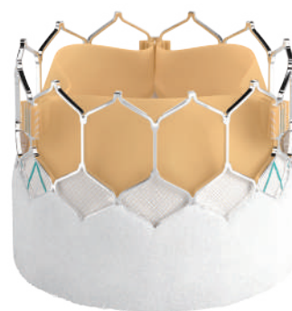
▲TAVIに用いる人工弁

加齢とともに大動脈弁が固くなり、大動脈弁狭窄症になる方が増えてきます。これに対し折りたたんだ人工弁をカテーテルで運び、狭くなった自己弁を押し広げる治療です。