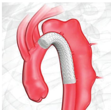
▲ステントグラフト内挿術

ハイブリッド 手術室は高性能な透視装置を組み込んだ手術室です。さまざまな手術がこの部屋で行われていますので、いくつかご紹介しましょう。