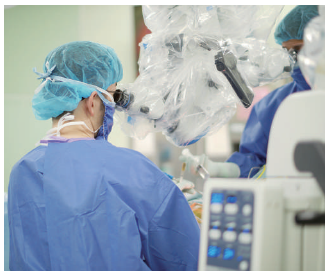
▲顕微鏡下手術の様子

山之内 脳と、その表面を覆うクモ膜との間に出血する病気です。多くの場合、脳動脈瘤が破裂することが原因です。特徴的な症状としては強い頭痛や意識障害です。ひとたびクモ膜下出血が起こった際には、脳動脈瘤の再破裂を防ぐために開頭クリッピング術やカテーテルによるコイル塞栓術を行います。