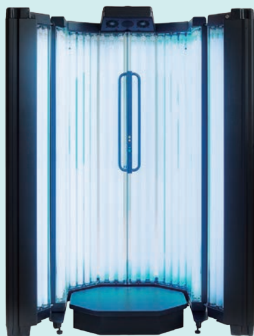
▲ナローバンドUVB照射装置

膚疾患の治療という外用薬や内服薬を思い浮かべる方が多いと思いますが、紫外線(UV)を用いた治療も古くから行われています。紫外線には免疫反応を抑制する効果があり、自己免疫が関係する疾患の治療に有効です。