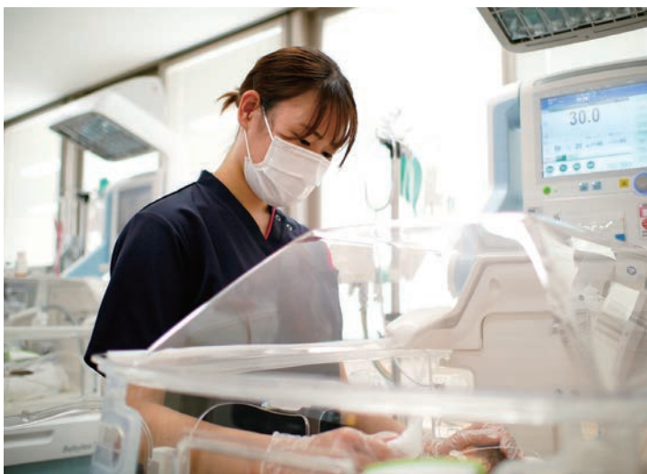
▲保育器内で赤ちゃんのケアを行う

いけません。胎内から胎外への急激な変化に適応できず、呼吸障害や低血糖などさまざまな症状をきたして治療を必要とすることがあります。また、予定より早く生まれた早産児や低出生体重児、心臓病などの生まれつきの病気を持った赤ちゃんもNICUでの治療が必要です。