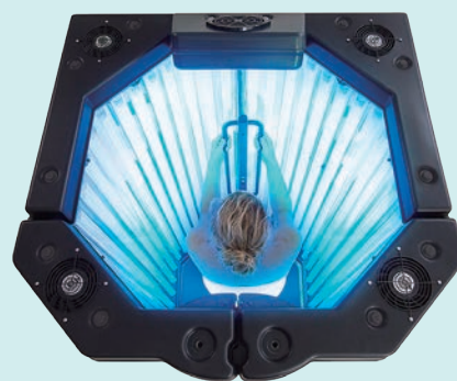
▲ナローバンドUVB照射装置

しかし、ご存じのとおり紫外線には有害な成分も含まれます。安全性に関する研究の結果、比較的波長の長いUVA(320~400nm)が最初に治療に用いられるようになりました。ソラレンという光に対する感受性を高める薬剤と組み合わせたPUVA療法は現在も乾癬などの主要な治療法のひとつです。